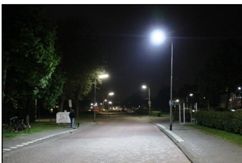
Afbeelding zonder strooilicht (jonge heldere ogen)