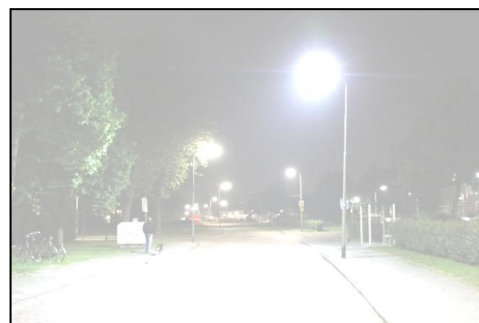
Afbeelding met strooilicht (kan al vanaf 35 jaar gaan opspelen)